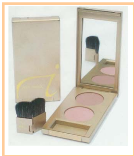
Twice Blushed 1 Ginger Whisper パーソナルカラーが春・秋の方 $46.00

先月お知らせしました、Twice Blushed は今月の25日までにお求め下さい。 二つの頬紅が鏡付きの洒落たコンパクトに入りました。 頬紅一つは27ドルですので8ドルお得です。