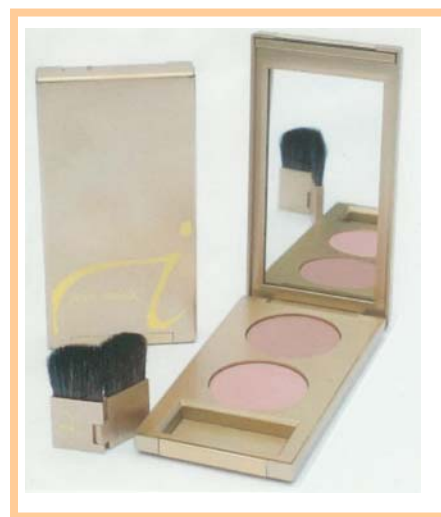
Twice Blushed 2 Cinnamon Cotton Candy パーソナルカラーが冬・夏の方 $46.00

Jane Iredale の二つのブラシを一つのコンパクトに入れました。 限定販売期間： 5月25日迄