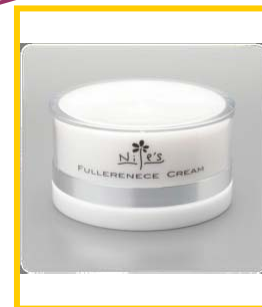
フラーレンクリーム ($95)